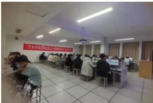
图 1：专项职业能力-办公软件应用培训

专项职业能力培训的开展，进一步提升了学生职业技能水平，为学生创业就业插上了腾飞的翅膀。