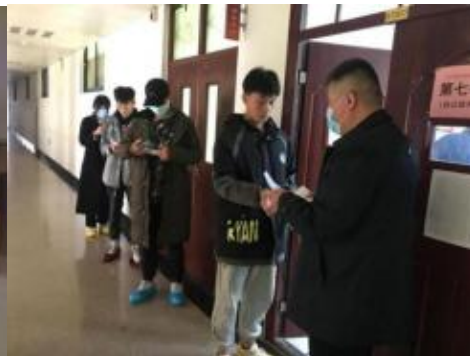
图 2：专项职业能力鉴定考试入场